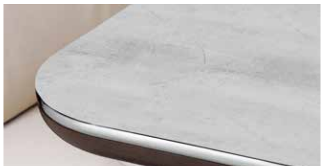
Tischplatte Marmor, Tischkantenfarbe Palisander