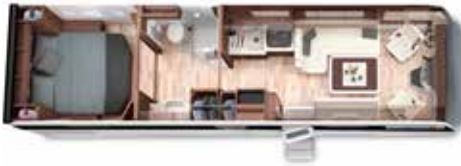
PALACE LINER 93 MB