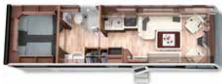
PALACE 88 LB