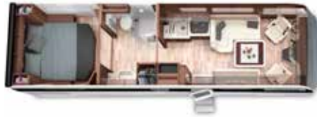
PALACE LINER 90 M