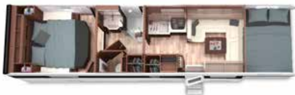
ALKOVEN 95 GB