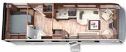
PALACE 81 F