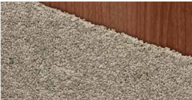
Teppich Velours Graubraun