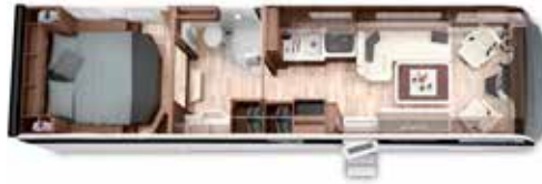
PALACE LINER 95 GB