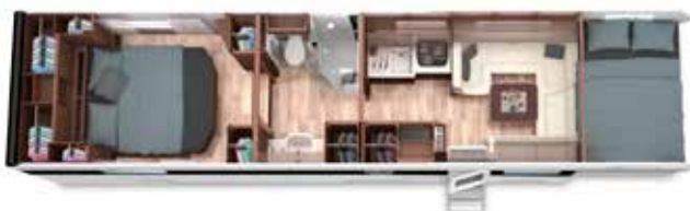
ALKOVEN 103 GB