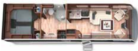
PALACE 90 LS