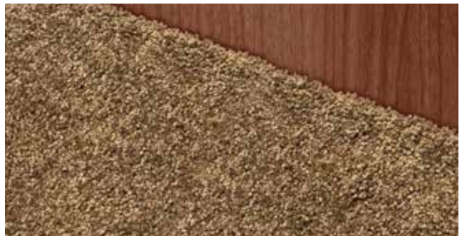
Teppich Velours Schoko