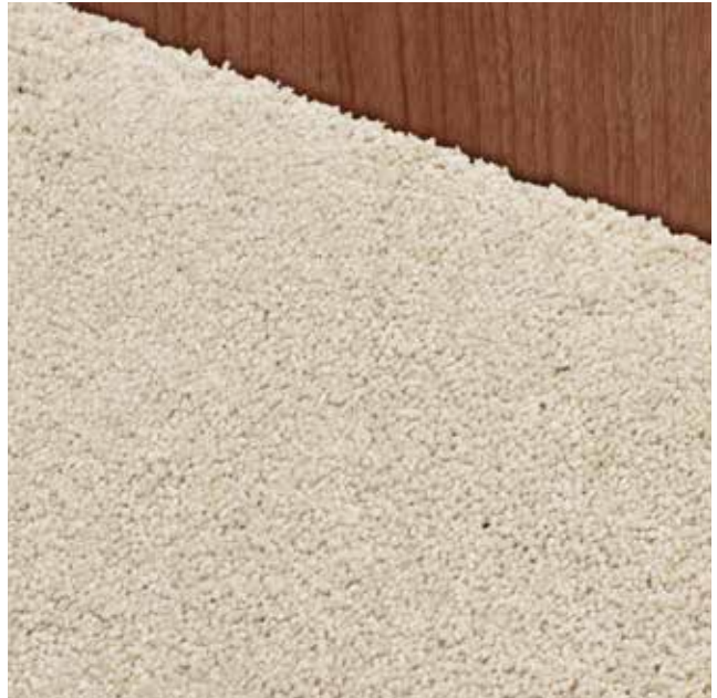
Teppich Velours Beige