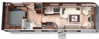
PALACE 84 FB