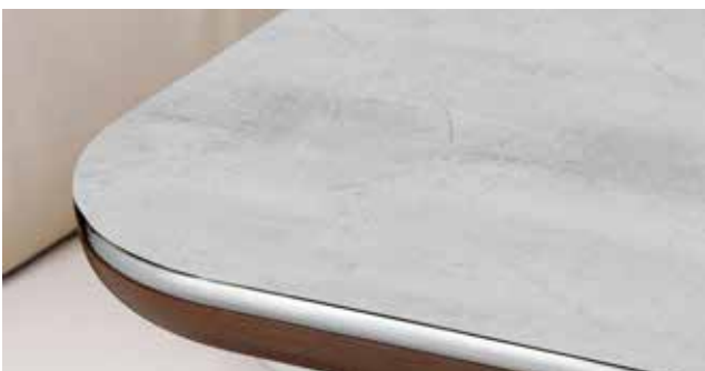
Tischplatte Marmor, Tischkantenfarbe Macadamia