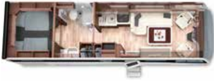
PALACE LINER 88 LB