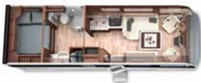
PALACE 80 H