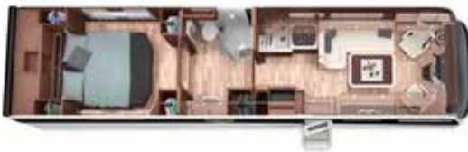
PALACE LINER 103 GSB