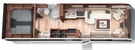
PALACE 90 LBX