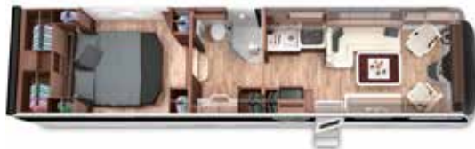
PALACE LINER 108 GSB