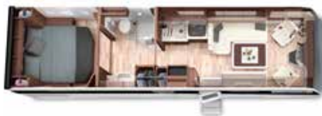
PALACE 93 MB