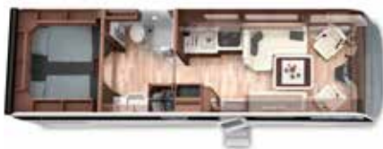
PALACE 85 L