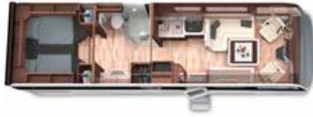
PALACE LINER 90 LS