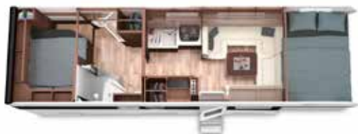
ALKOVEN 86 FB