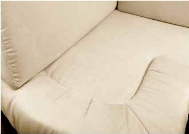
Denver 101 Sahne

Ergonomisch geformte Polster mit Diolenwattierung bieten hervorragenden Sitzkomfort. Die teflonbeschichtete Microfaseroberfläche ist schmutzabweisend und äußerst strapazierfähig. Reißverschlüsse ermöglichen den Wechsel der Bezüge zur intensiven Reinigung.