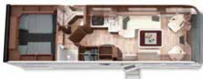
LOFT 82 LB