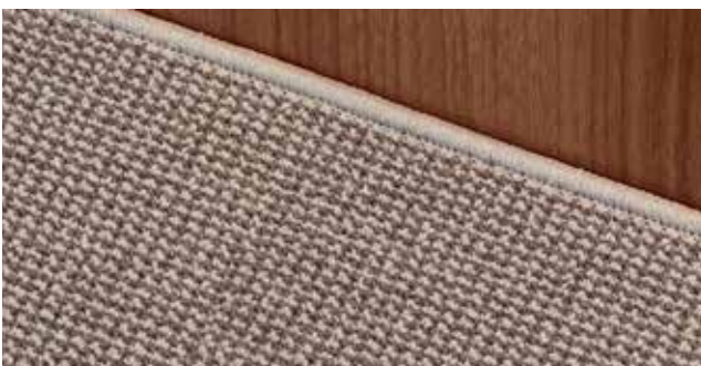
Teppich Sisal Sierra