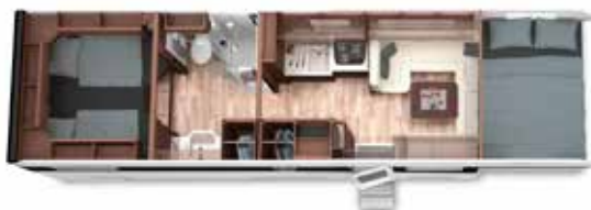
ALKOVEN 90 LB