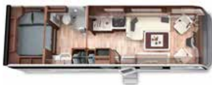
PALACE 83 HB