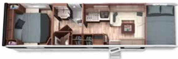
ALKOVEN 95 MB