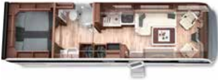
PALACE LINER 90 LBX