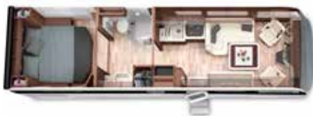
PALACE 90 M