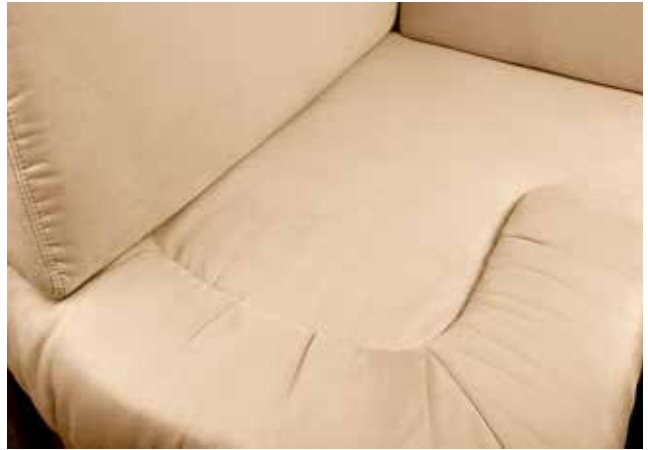
Denver 105 Creme beige