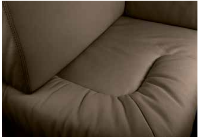
Nairobi 2262 Caffé