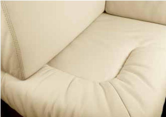
Malibu 3819 Sahne

Bei der optionalen Lederausstattung verwendet MORELO weiches und zugleich kräftiges Rindsleder mit eleganter Oberflächenstruktur. Die Oberfläche ist schmutzabweisend und kann bei Bedarf leicht mit einem feuchten Tuch gereinigt werden.