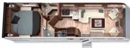
LOFT 87 MB