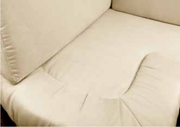
Denver 101 Sahne

Ergonomisch geformte Polster mit Diolenwattierung bieten hervorragenden Sitzkomfort. Die teflonbeschichtete Microfaseroberfläche ist schmutzabweisend und äußerst strapazierfähig. Reißverschlüsse ermöglichen den Wechsel der Bezüge zur intensiven Reinigung.