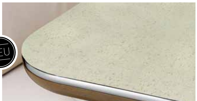
Tischplatte Granit, Kante Life (oder Trend)