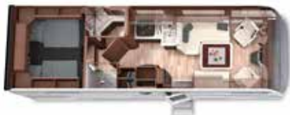
LOFT 79 L