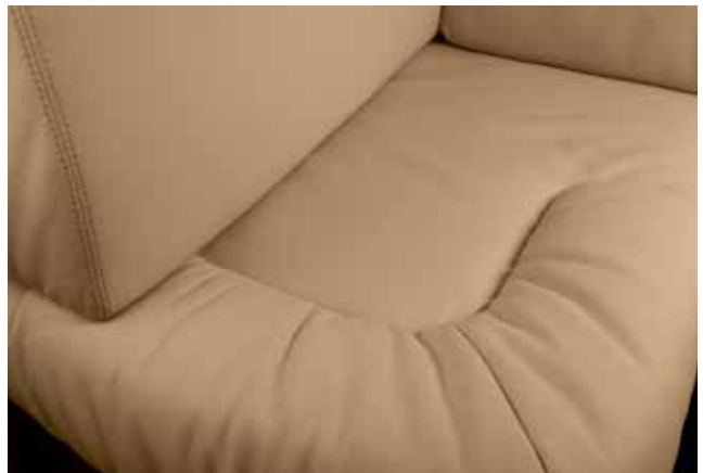
Monaco 3688 Savanne