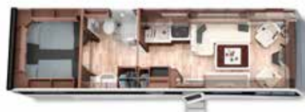
LOFT PREMIUM 87 LB