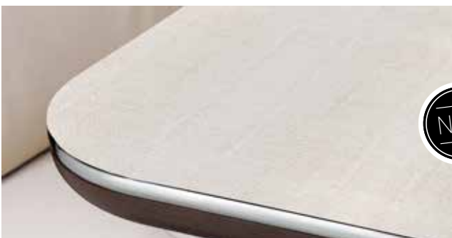
Tischplatte Quarz, Kante Trend (oder Life)