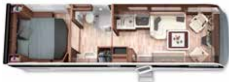
LOFT PREMIUM 89 M