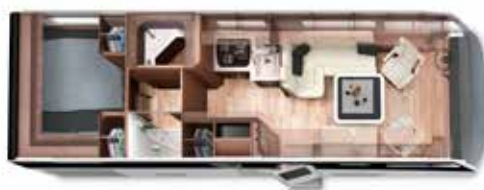
HOME 78 HS