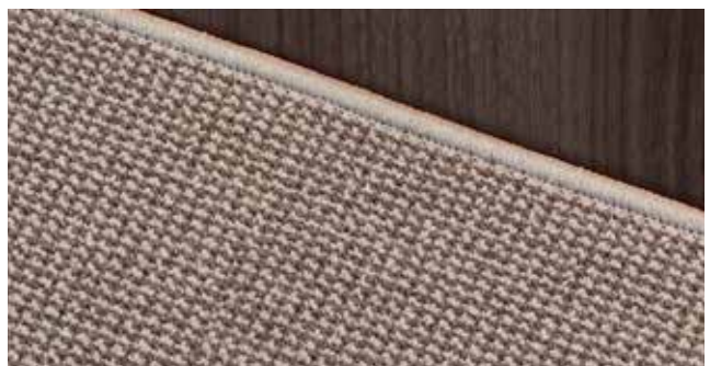
Teppich Sisal Sierra