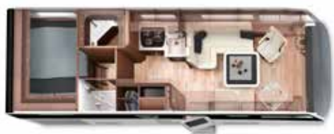
HOME 74 H