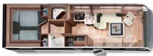
HOME 82 LS