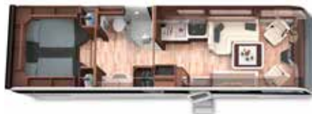
LOFT PREMIUM 89 LS