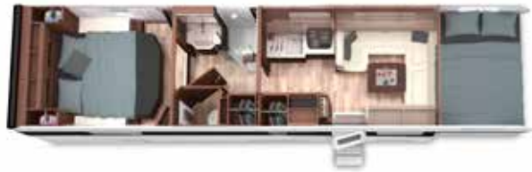
ALKOVEN 95 GB