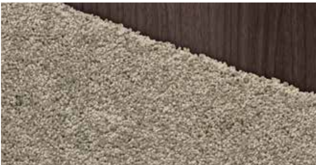
Teppich Velours Graubraun