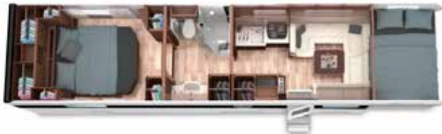
ALKOVEN 103 GSB