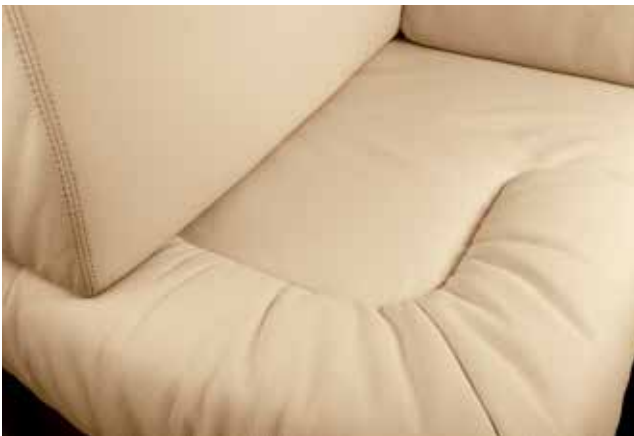
Dallas Creme beige 3753