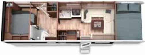
ALKOVEN 86 FB