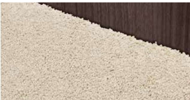
Teppich Velours Beige