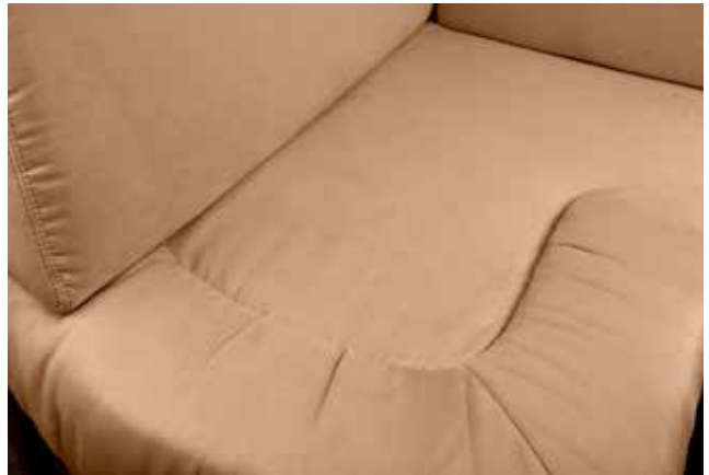
Denver 146 Caramell