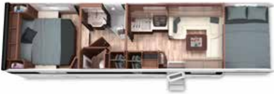
ALKOVEN 95 MB