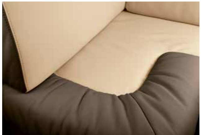
BiColor Nairobi 2262 Caffé / Dallas 3753 Creme beige