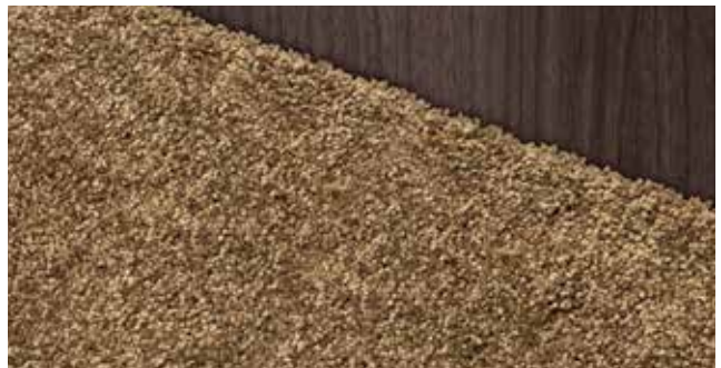
Teppich Velours Schoko