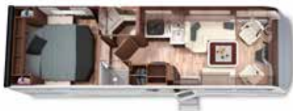
LOFT 84 M