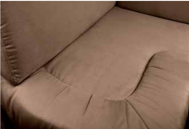
Denver 169 Coffee