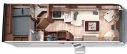
LOFT 77 HB