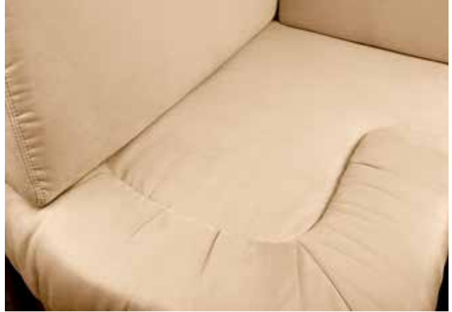
Denver 105 Creme beige