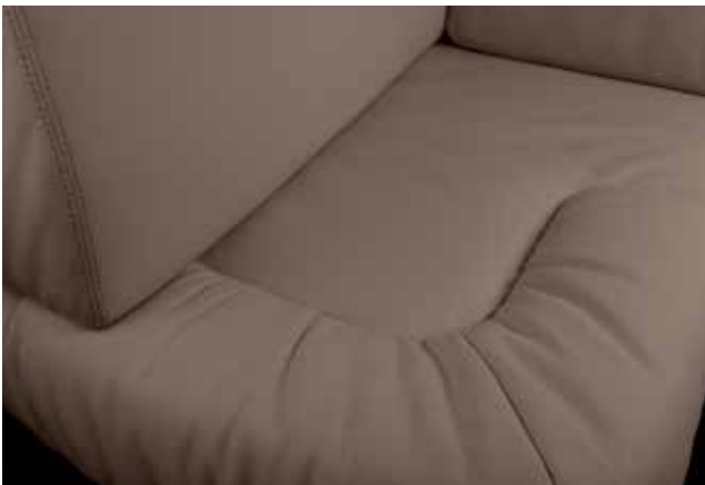
Delhi 1434 Stone