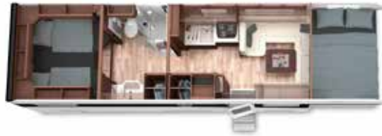
ALKOVEN 90 LB