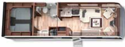
LOFT PREMIUM 84 L